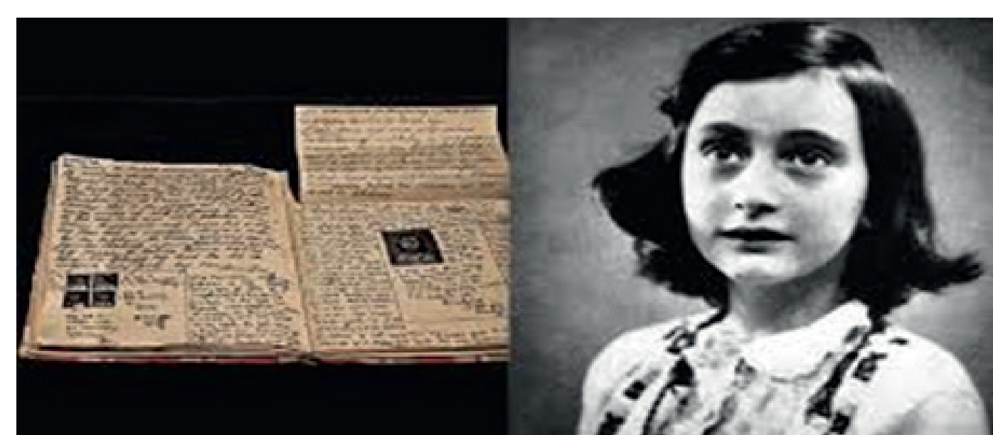
Imagen de la apariencia física de Ana Frank y de su diario original.

Por esta razón, junto a mi compañero, decidimos hacer una entrevista ficticia con preguntas acerca de cómo vivía durante esta época y sobre su famoso diario.